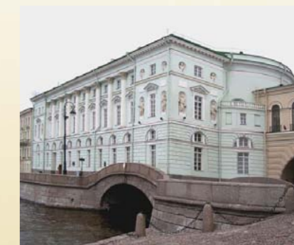
Эрмитажный театр (арх. Джакомо Кваренги)