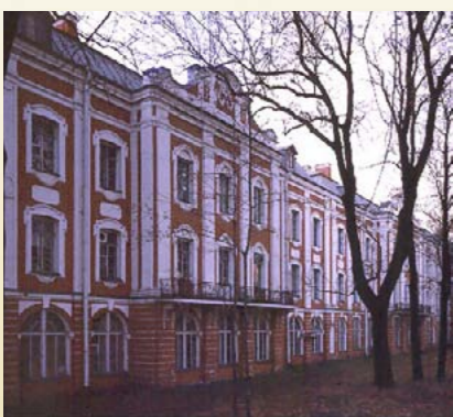
Санкт-Петербургский государственный университет

Санкт-Петербург, пл. Театральная, 1; тел.: +7 (812) 326-41-41 www.mariinsky.ru