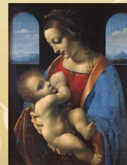
Мадонна с младенцем, Леонардо да Винчи (гос. Эрмитаж)