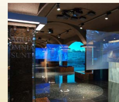
Музейный комплекс «Вселенная воды»

тел.: +7 (812) 438-43-75 www.vodokanal-museum.ru