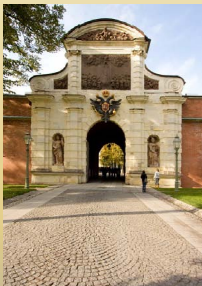
Петровские ворота. Петропавловская крепость (арх. Доменико Трезини)