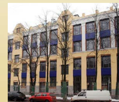
Конгрессный Центр (КЦ) «ПетроКонгресс»

Конгрессный Центр «ПетроКонгресс» Россия, 197110, Санкт-Петербург, Лодейнопольская ул., д. 5, ст. метро «Чкаловская» тел./факс: +7 (812) 335-89-00 e-mail: sales@petrocongress.ru web: www.petrocongress.ru