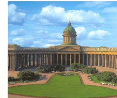
Собор Иконы Казанской Божией Матери (Казанский собор)

Санкт-Петербург, Казанская площадь, д. 2; тел.: +7 (812) 314-46-63 www.kazansky-spb.ru