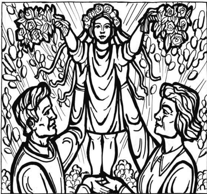
100 лет СССР. Счастливое детство