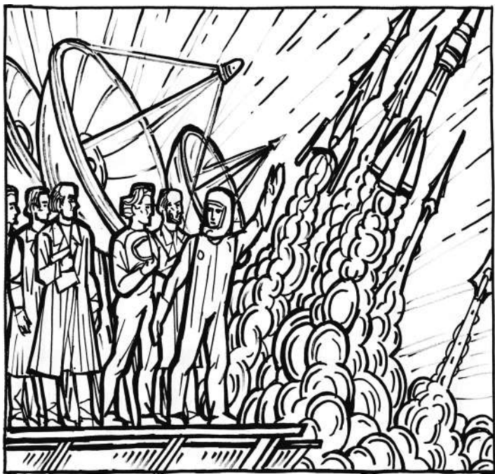
100 лет СССР. Дорога в космос