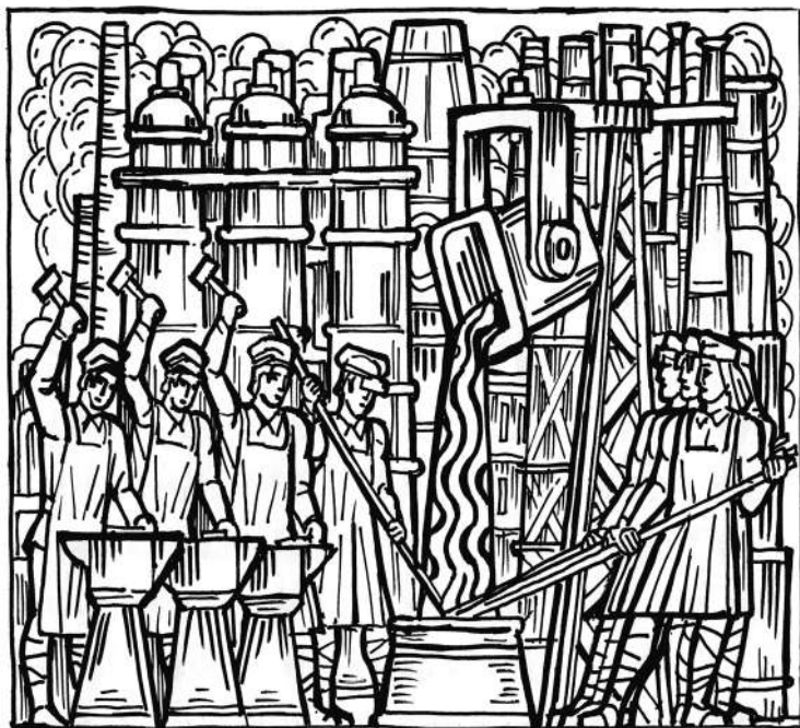
100 лет СССР. Индустриализация