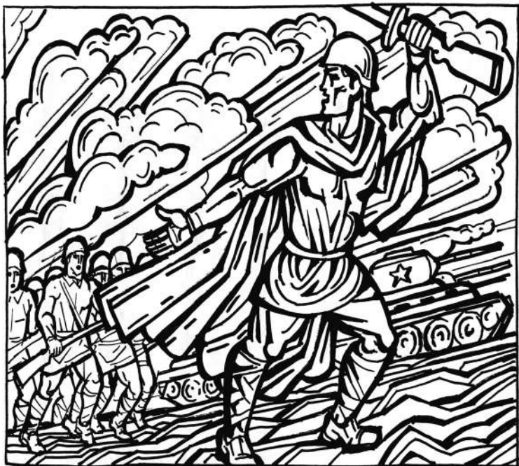
100 лет СССР. Великая Отечественная война