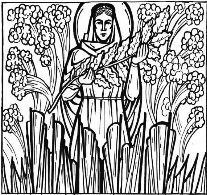
100 лет СССР. Победа